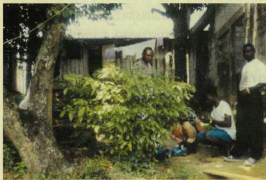
Grm Iboga je znano zdravilo in obredna droga.

Spol za opravljanje obreda zdaj ni več omejitvev. Zato ker vlada prepričanje, da izkušnja z ibogo širi obzorja in dviguje inteligenco, se za obred odloči tudi veliko žensk. Presenetljiva pa je starost kandidatov, saj so za naše razmere še otroci.