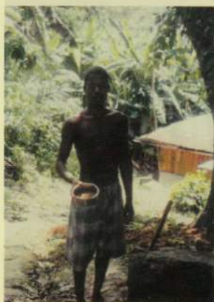
Posušena in zmleta skorja korenine.

Po prvih informacijah naj bi en sam tretma z ibogainom prekinil odvisnost od heroína, kokaina, alkohola in nikotina. Začetno navdušenje pa je bilo pretirano. Za nekaj časa res zatre željo po jemanju drog, tudi abstinenčnih simptomov ni, vendar pa ta učinek čedalje bolj slabi in brez socialne rehabilitacije zasvojenecv nikakor ne doseže obljubljenih 70 odstotkov ozdravitev.