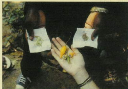
Plodovi iboge ne učinkujejo niti halucinogeno niti požvljajoče.

Stanje, doseženo zvečer, traja celo noč, in sicer ob spremljavi tradicionalne glasbe, petja in plesov, ki so popotnica na poti v deželo Bwiti – deželo prednikov, deželo mrtvih, kamor naj bi človek v življenju šel dvakrat; na dan iniciacije in na dan smrti.